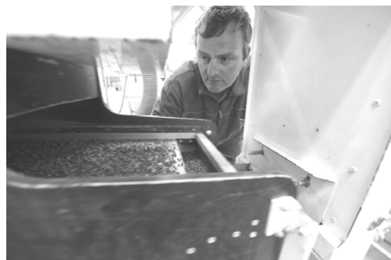
Evaluation de la germination et tri des graines à la sécherie de la Joux.